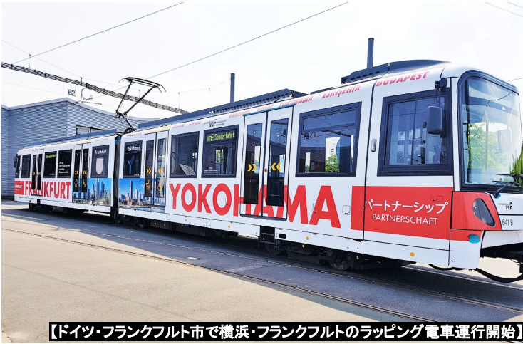
【ドイツ・フランクフルト市で横浜・フランクフルトのラッピング電車運行開始】

企画担当 (Inquiries) 045-671-4700・ki-somu@city.yokohama.jp