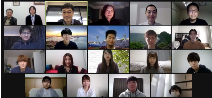
【国際連合日本人職員による横浜市内大学学生向けオンライン講演会の様子】

企画担当 (Inquiries) 045-671-4700・ki-somu@city.yokohama.jp