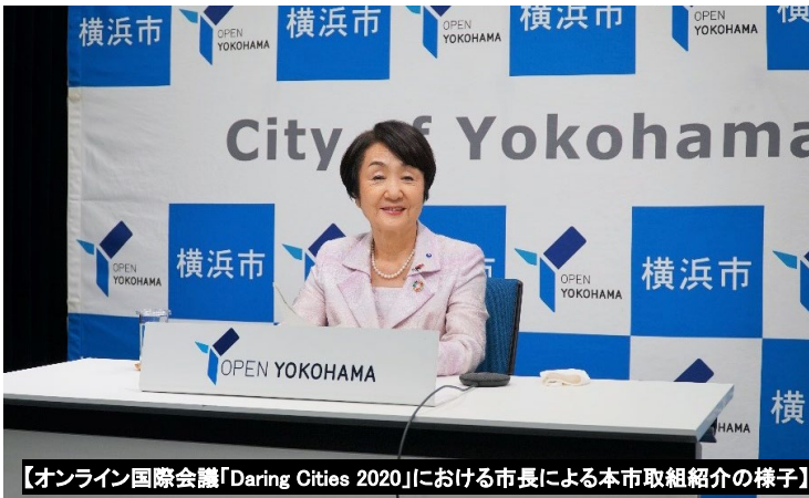
【オンライン国際会議「Daring Cities 2020」における市長による本市取組紹介の様子】

【発行】横浜市国際局政策総務課 Yokohama International Affairs Bureau, General Division 企画担当 (Inquiries) 045-671-4700・ki-somu@city.yokohama.jp