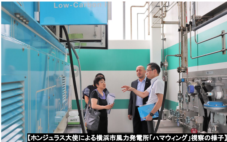
【ホンジュラス大使による横浜市風力発電所「ハマウイング」視察の様子】