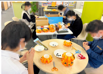
【地域ユースプラザの活動】