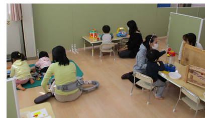
【センターにおける「ひろば事業」の様子】

利用児童の増加が顕著な東部地域療育センターについて、集団療育を実施する場所として児童発達支援事業所を増設します。