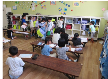
【放課後キッズクラブの活動】