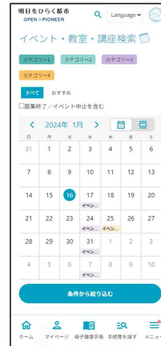
イベントカレンダー マイカレンダー