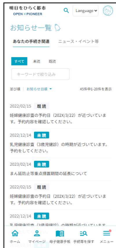
お知らせ・トピックス お役立ち情報 など