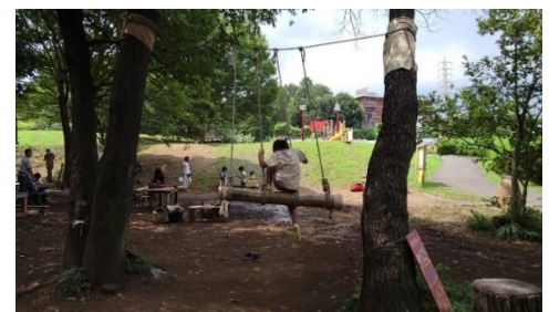
【プレイパークの活動】