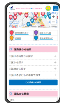
【えんさがしサポート★よこはま保育】

少人数できめ細やかな支援ができる小規模保育事業の魅力を伝える動画等を作成・掲載します。