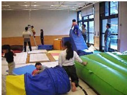
【センターにおける療育の様子】