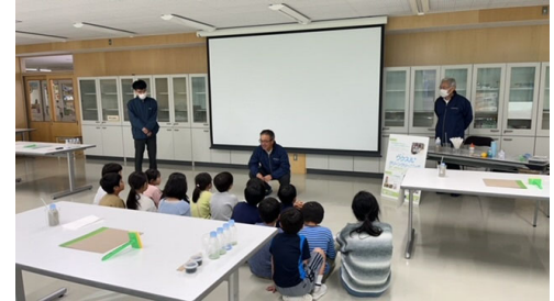
【プログラムの様子】

クラブにおいて地域や民間事業者等と連携したイベントやプログラムが実施できるよう支援します。