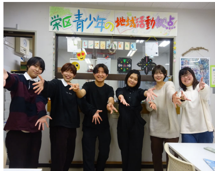
【青少年の地域活動拠点の活動】