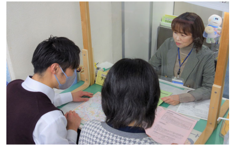
【相談に応じる保育・教育コンシェルジュ】

保護者のニーズと必要なサービス等を適切に結び付けるため、保育所等の申請が集中する期間について、各区に配置した保育・教育コンシェルジュが実施する申請者への個別フォローを強化します。