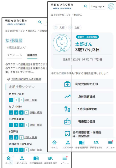
母子健康手帳 予防接種スケジュール