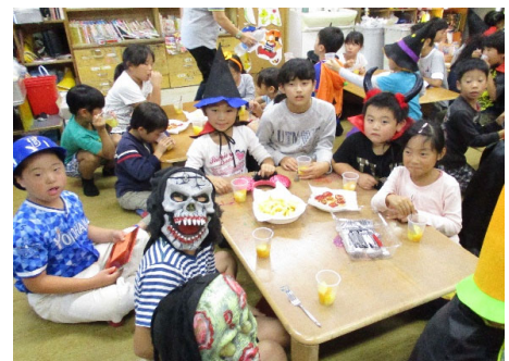
【放課後児童クラブの活動】