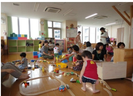
【地域子育て支援拠点】 (戸塚区・とつとつ)