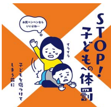
【子どもへの体罰禁止啓発ポスター(左)】

この改正を踏まえて、区役所へのこども家庭総合支援拠点の整備による「こども家庭相談」の実施や要保護児童対策地域協議会の関係機関向け研修、SNS等既存の広報媒体にとらわれない様々な方法での広報・啓発の実施などを通じて、児童虐待の防止、体罰等によらない子育てを推進します。