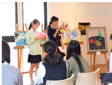
【青少年の地域活動拠点の活動】

ウ 青少年の地域活動拠点における地域連携体制強化 都筑区において、青少年の地域活動拠点が地域に出向き、新たな地域人材・既存施設との連携体制を構築・強化することで、青少年の課題の早期把握・早期支援を行います。