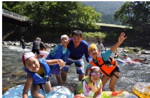
【放課後児童クラブの課外活動】

クラブにおいて地域や民間事業者等と連携したイベントやプログラムが実施できるよう支援を行います。