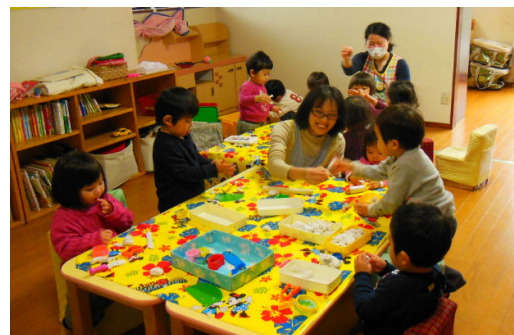
【乳幼児一時預かり事業】 (青葉区・子どもミニデイサービス まーぶる)