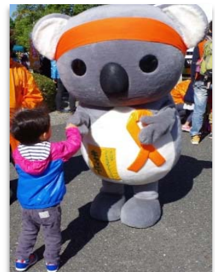
【横浜市児童虐待防止キャラクター「キャッピー」による啓発活動の様子(右)】