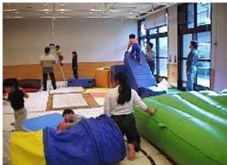
【地域療育センターにおける療育訓練の様子】