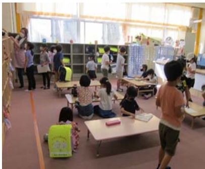
【放課後キッズクラブの活動】