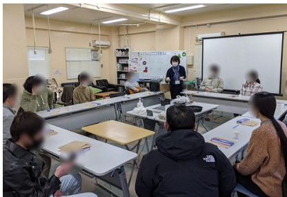
【地域ユースプラザの活動】