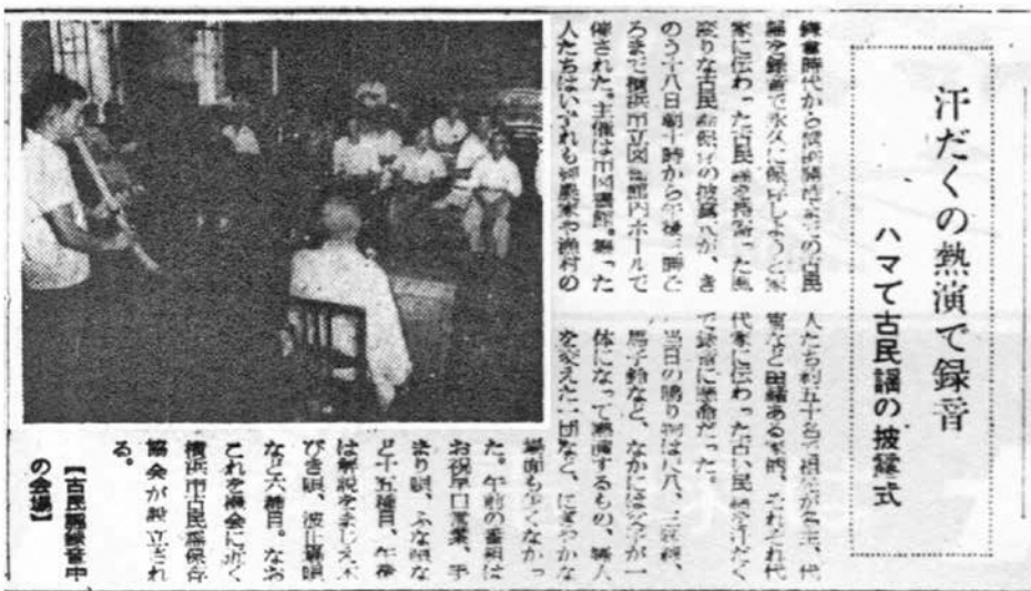
横浜市立図書館での古民謡録音（『神奈川新聞』昭和32年8月19日）