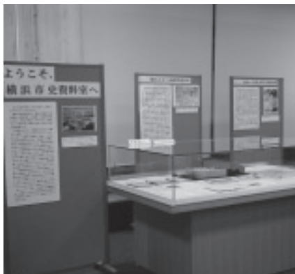
資料室内展示コーナー

また、カウンターでは昭和の横浜に関する文献・資料等に関するお問い合わせにも応じています。お気軽に声をおかけ下さい。