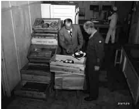
販売前のパイやケーキの検査 1949年1月6日

そばの第一五五病院にキリスト教の教会、馬車道にユダヤ教の教会があった。これらの教会では、定期的な礼拝集会だけでなく、結婚式も行われ、様々な相談に応じたり、援助も行っていた。