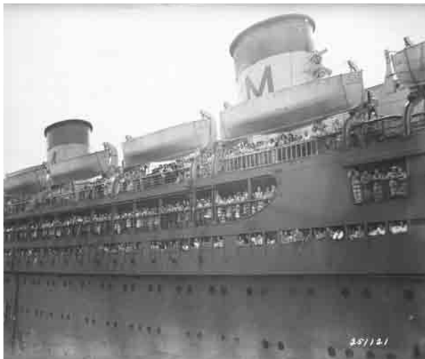
約800人の家族を乗せて横浜に到着した米軍輸送船モントレー号 1946年8月10日

者・救急車、「公共サービス」は電気・ガス・水道の修理、「住宅管理」は住宅に関する各担当のオフィス、「労務」は使用人の雇い入れに関する連絡先、「その他」にはゴミの収集、氷や燃料・新聞の配達、清掃などに関する連絡先が掲載されている。日本食に関する連絡先も、含まれているのが興味深い。