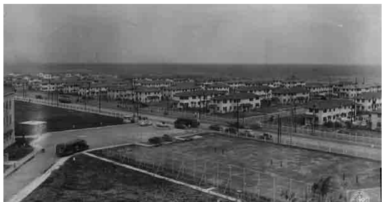
本牧の米軍家族住宅「エリア1」 1948年11月5日 中央と左手に米軍専用バスが見える。

三月から一〇月にかけて急速に家族住宅が建設され、六月から家族の来日が始まる。今回紹介する案内パンフレット以前に、同様のパンフレットが発行されていたかどうかは不明であ