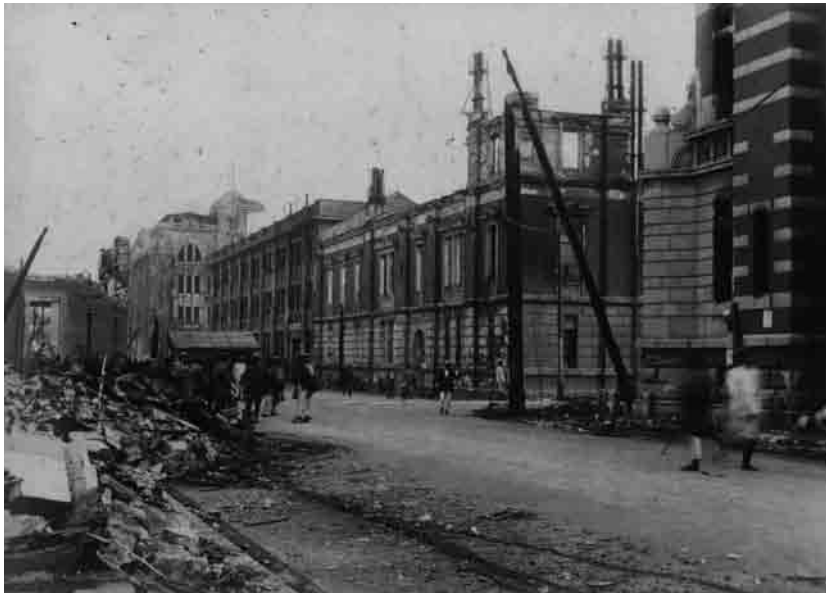
関東大震災直後の県庁前交差点(1923(大正12)年9月中旬頃)