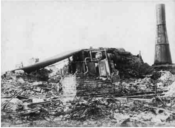
焼けたグランドホテル(1923(大正12)年9月中旬頃)

借りしました。手分けして缶詰は一滴残らず口に口に入れて歩く、消毒剤も医料も使い果たしてしまった。