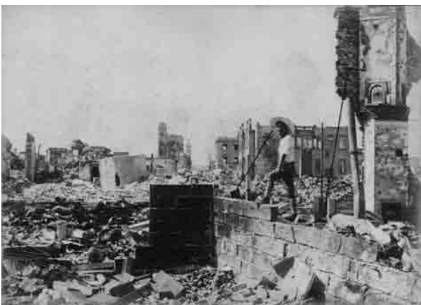
山下町から本町通りを望む(1923(大正12)年9月中旬頃)

かねてより御尊顔を拝し、関東大震災の当日の有様を、個人として、申しあげたく存じておりましたが、その折もなく、一〇〇歳になってしまいました。勿論、(横浜)市には沢山の記録がございますが、東京のことは大きく新聞やテレビで報ぜられておりますが、横浜全土が焼土と化した惨事は、あまり知らされてないように思いますので、ほんの一部でもお役に立つ箇所があれば幸と存じ、書いてみました。私は二十歳の時、ソ連の会社におりました。周囲は各国の貿易商も多く並んでいました。突然、ゴ—、というすさまじい音にとび出した途端、地面は音を立てての土煙り、転んでは立ち、立っては転ぶの数分間で手も足もコンクリートで血だらけ、何が何だかさっぱり判らず茫然としているとき、火事だ、