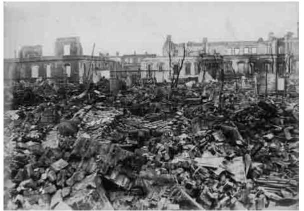
山下町の惨状(1923(大正12)年9月中旬頃) 前川浄二家資料(横浜市史資料室所蔵)

字下粕谷(現・伊勢原市)出身の帝さんは、厚木の女学校を卒業した後、鎌倉で看護婦の勉強をし、その後、山手町の外国人住宅に勤める幼馴染の紹介で山下町一五七番地(現・ファミリーマート山下町店周辺)に所在するロシア系企業、スピルマン商会に事務員として勤めた。帝さんの記憶に依れば、同商会は香水を取り扱う会社で、帝さんは商会内に住み込みで働いていた。そして、地震発生の一九二三(大正一二)年九月一日もスピルマン商会内で罹災し、着の身着のまま、和服に下駄履きの姿で横浜公園に避難したという。