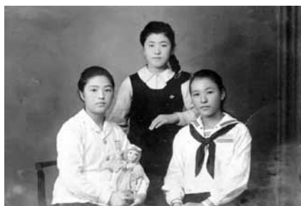
女学校時代 1943（昭和 18）年

会期：7月14日(土)～9月17日(月・祝) 時間：午前9時30分～午後5時 休館日：7月17日(火)、8月20日(月) ◎入場無料