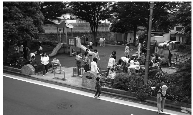
公園愛護会の活動