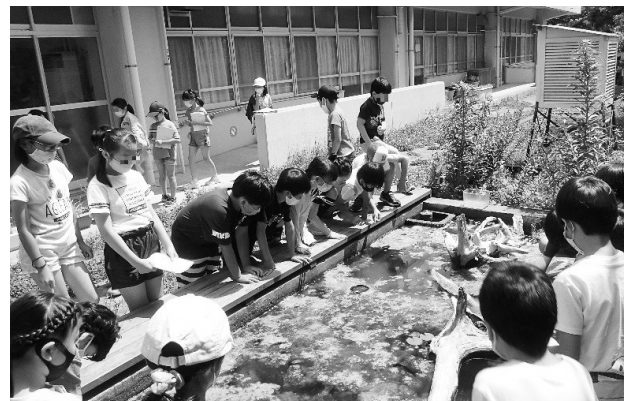
環境教育出前講座「ビオトープで小さな生態系を感じてみよう」

生物多様性の損失や地球温暖化といった環境問題への理解を深めるため、市内の小中学校や地域の方々を対象に、市民団体、企業、国際機関、市役所など専門知識を持った講師が講義を行う「環境教育出前講座」を実施しています。令和3年度は6,210人が環境教育出前講座を受講しました。