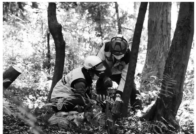
上川井市民の森で開催した森づくり体験会の様子