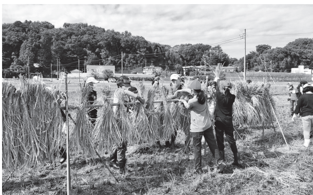
北八朔恵みの里での体験水田

食と農への関心や、農とのふれあいを求める市民の声の高まりに応えるため、様々な市民ニーズに合わせた農園の開設など市民が農とふれあう機会の提供を支援します。 様々な市民ニーズに合わせた農園の開設： 4.59ヘクタール 横浜ふるさと村、恵みの里での農体験教室等：86回