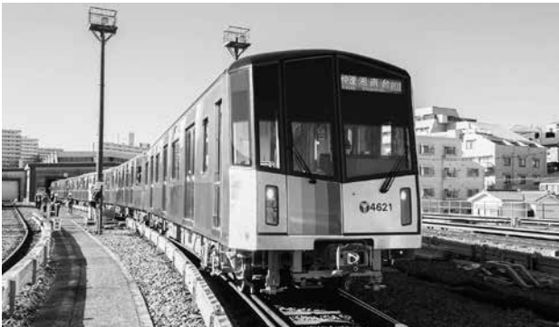
ブルーライン 4000 形車両