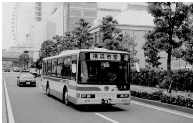
走行中の市営バス