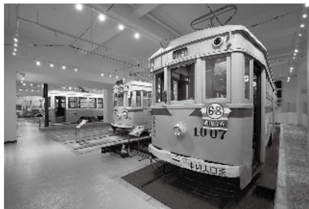
かつて横浜を駆け巡った市電を当時の姿で7両展示

昭和47年に廃止されるまで市民の皆さんの足として親しまれていた横浜市電の車両やパネルを展示しています。また、新たなジオラマゾーン（ハマジオラマ）や横浜の発展と都市交通のあゆみをテーマとした歴史展示コーナーもあります。