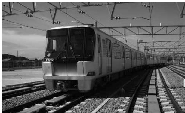
グリーンライン 10000 形車両

トンネル内には限界支障センサーを設置し、センサーが反応した場合は、その反応したエリア内を停電させ、列車を緊急停止させます。また、各車両に 4 箇所ずつ、非常通報装置を設置しています。通報時に乗務員が対応できない場合は、総合司令所が応答し、車内での非常時の速やかな対応を図っています。