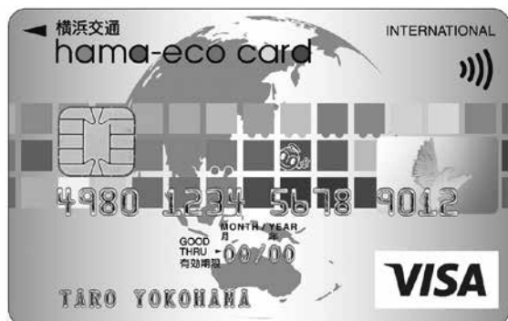
横浜交通 hama-eco カード

このカードで、市営バス・地下鉄の定期券を購入すると翌年度のカード年会費が無料になるほか、「パスポートチャージ」や電子マネー「iD」にも対応しています。