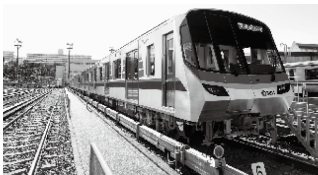
ブルーライン 3000V 形車両