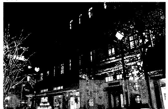
写真—2 ハーバースタイル・ファンタジー