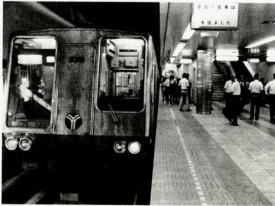
地下鉄利用者は1日平均13万人

歩きやすく、また運転しやすくするため、市民が日常利用する道路については、全面舗装をめざしている。舗装率は、過去四年間に六%強進み、五六年度末現在では八二・七%になっている。とくに、郊外区の舗装に重点を置き、緑区では一一%進み、戸塚・港南・港北の三区では七・九%進んだ(図-2)。