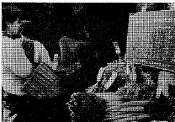
標準小売価格標示店

野菜や魚は季節によって同一の品でもかなりの値巾がつくものである。これは一般に保存のきかない生鮮食料品の宿命ともいつべきで、供給すなわち入荷量の多寡によって価格はほとんど決定してしまう。生産者・産地仲買人・出荷組合によって早朝中央市場に持ち込まれた野菜・魚は、「せり」によって業者の手におち、さらに場合によっては仲買業者の手をへて、小売りの店頭と並ぶ。すなわち、生産者・消費者の意志と無関係に価格が決定するのである。そこで、消費者・学識経験者・関係業者・市職員で構成する生鮮食料品標準価格設定協議会をつくり、3カ月ごとに表示品目と標準利益率を決定すること