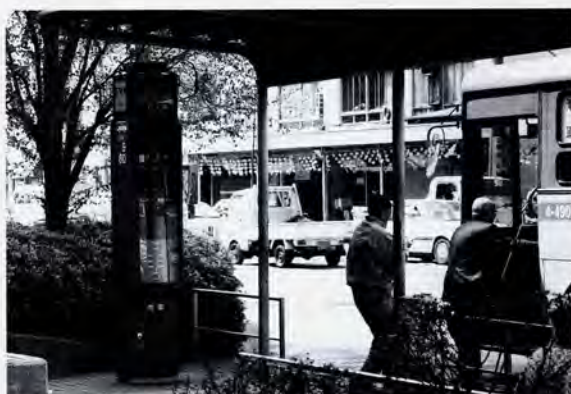
運行情報の提供、運行システムの改善がバス利用促進の決め手として期待されている