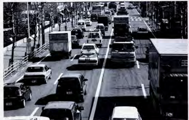
増え続ける自動車に対応した体系的な道路網の整備が急がれている

また横浜の鉄道路線は、横浜駅から放射状に伸びているのが特徴である。このため郊外部では鉄道路線から遠い地域が生まれ、二つの鉄道路線のはざまにある地