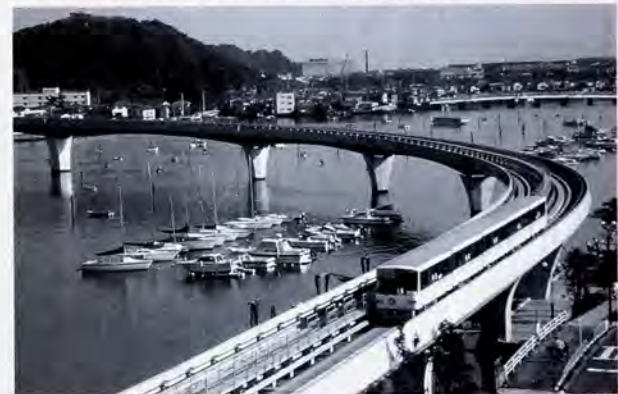
金沢八景をゆく「金沢シーサイドライン」。次代の輸送を担う交通システムとして注目の乗り物だ

域では、住宅地から駅に至るまでに、二十分から三十分もの長い時間バスに乗らなければならぬところもある。こうした「交通不便地域」の解消と混雑の緩和の二つが、いま早急に市に求められている課題なのである。