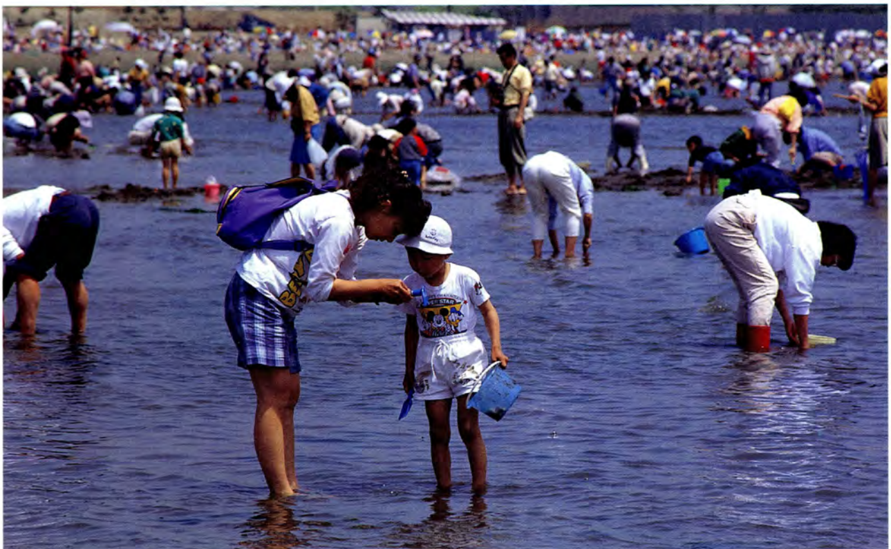
こんなの採れたよ (海の公園)