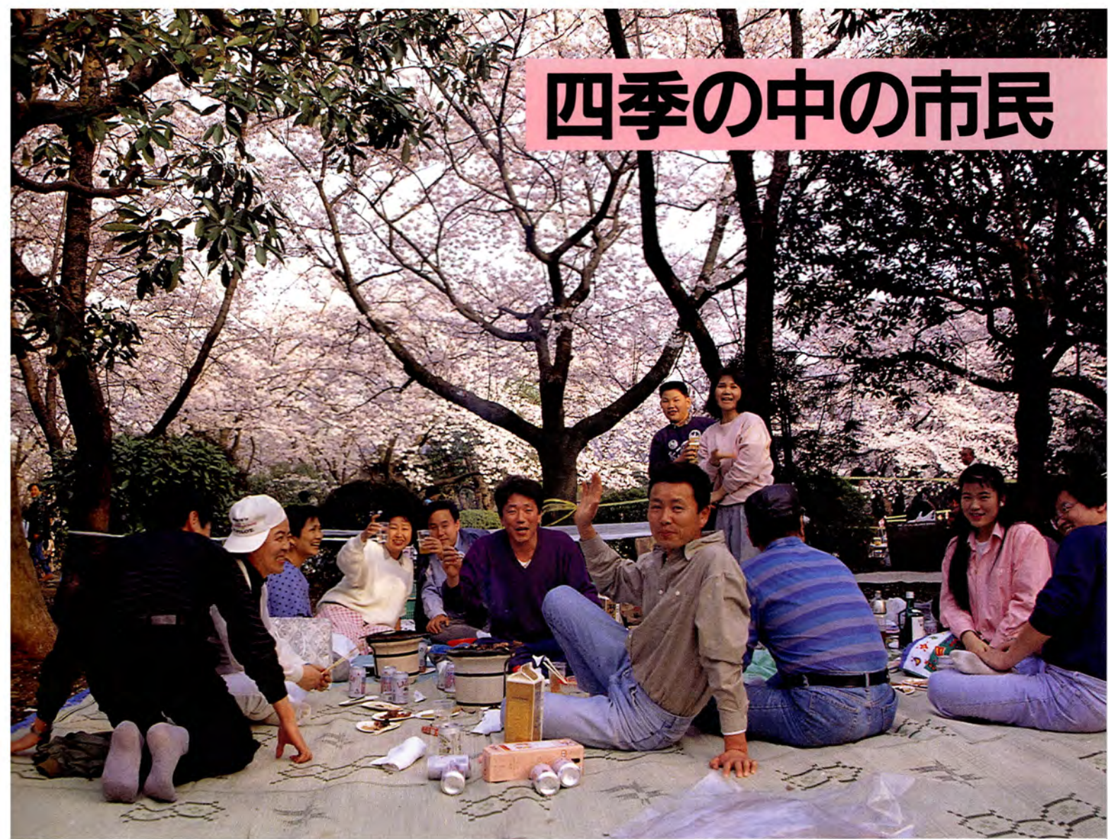
桜の下でさあ乾杯 / (三ツ沢公園)