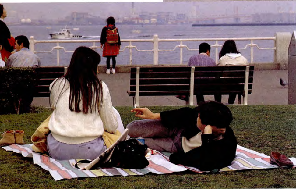
ゆったりと二人で過ごす午後 (山下公園)