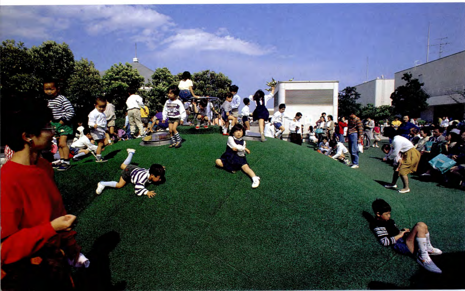
子どもの広場は大騒ぎ (横浜駅東口)