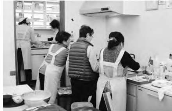
▲栄養バランスを考えたランチメニューとボランティアスタッフ

りならではの優しい味で、品数も豊富。自宅で食事を作ることができない高齢者を想定し、必要な栄養素を「食」で提供することを目指している(写真右上)。ランチの価格は500円(23年4月までは400円)。この価格と質を支えているのが30人を超える有償ボランティアスタッフである(写真右下)。また、食材については地元農家の協力を得ている。こうした地域一体となった取組の結果、開設当初の借入金も23年に完済するなど、経営的にも軌道に乗っている。