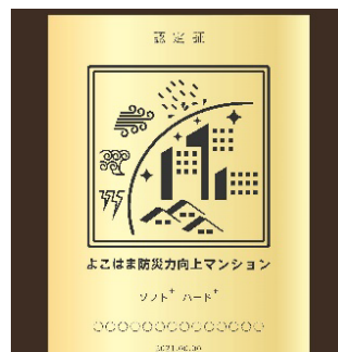
よこはま防災力向上マンション認定証