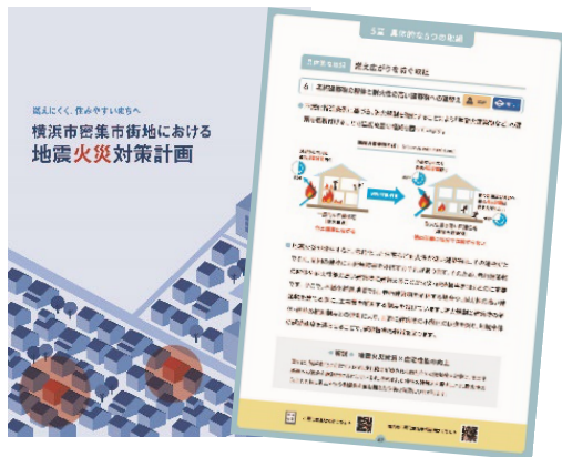
横浜市密集市街地における地震火災対策計画