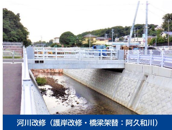
河川改修（護岸改修・橋梁架替：阿久和川）