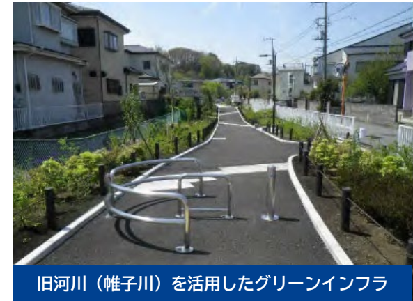
旧河川（帷子川）を活用したグリーンインフラ