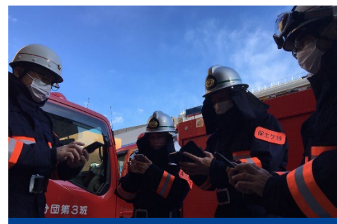
消防団アプリを操作する消防団員 (イメージ)