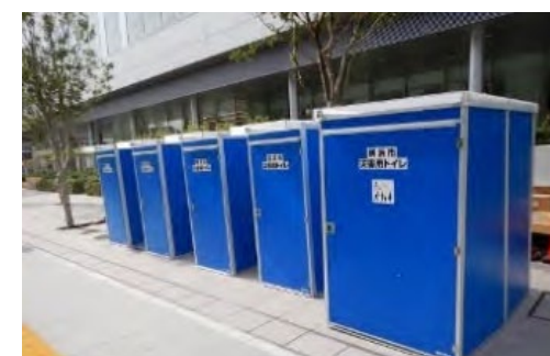
下水道直結トイレ (ハマッコトイレ)