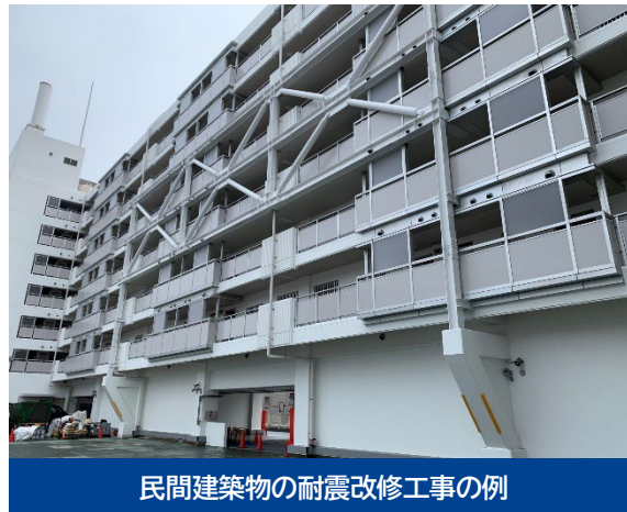
民間建築物の耐震改修工事の例