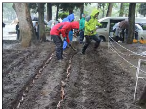
◎昨年度の植付けの様子