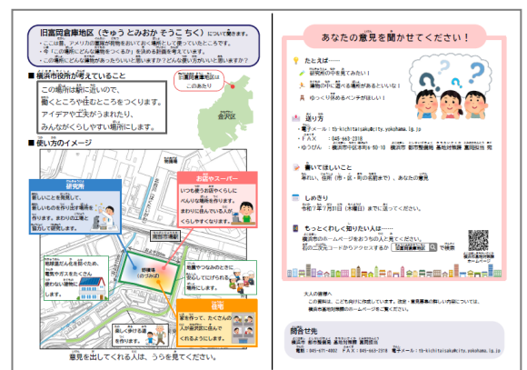
こども用リーフレット