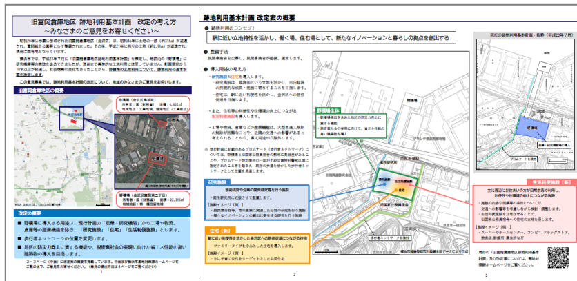
一般用リーフレット