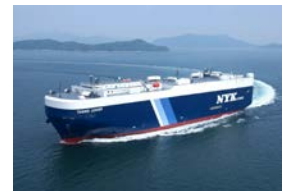
日本郵船(株)の自動車専用船船内見学会の実施(7/21) 事前申込制・定員 1,000 名