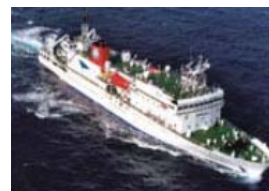
JAMSTEC の深海調査船の見学会の実施(7/22) 申込不要