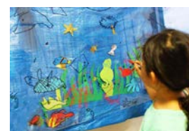
横浜美術大学による、巨大絵画制作などのアートワークショップを新たに実施