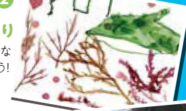
▶海藻おしば 作品例

ちりめん(しらす干し)の中からイカ、タコ、カニ幼生、イワシ以外の魚類などを探し出すゲーム。めずらしいモンスターをゲットしよう!