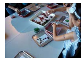
海について楽しく学べるワークショップも充実