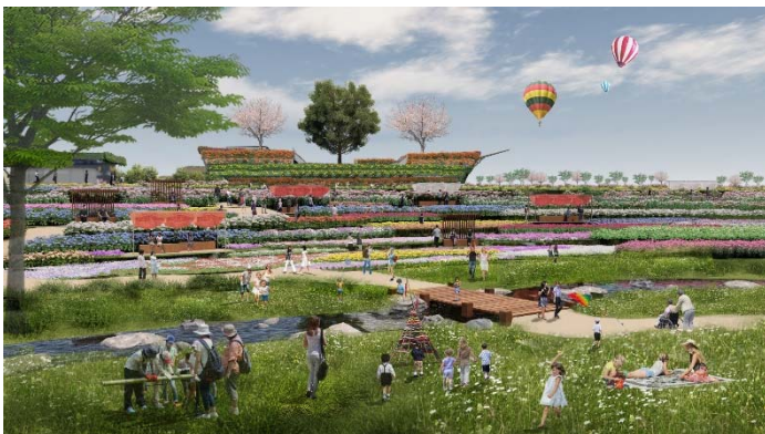
花と緑にあふれたアウトドアライフ