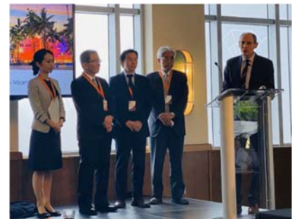
政府支持表明を歓迎する AIPH