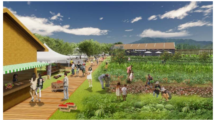
里山的環境を生かした新たなライフスタイル