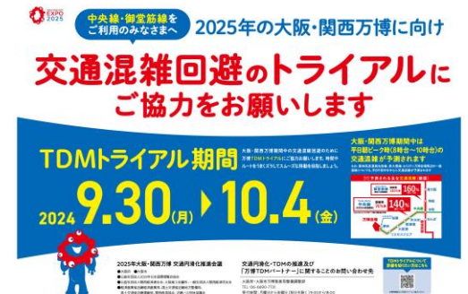
トライアルポスター

企業等のTDMへの参加促進及び課題の把握や、交通量低減におけるTDMの有意性の確認等を目的に、最も来場者が集中すると予測される会期末の約1年前にTDMトライアルを実施