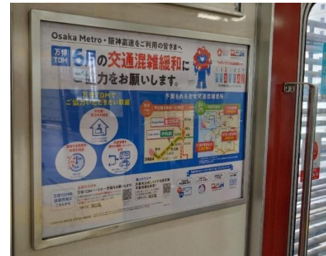
車両内広告(ドア横)