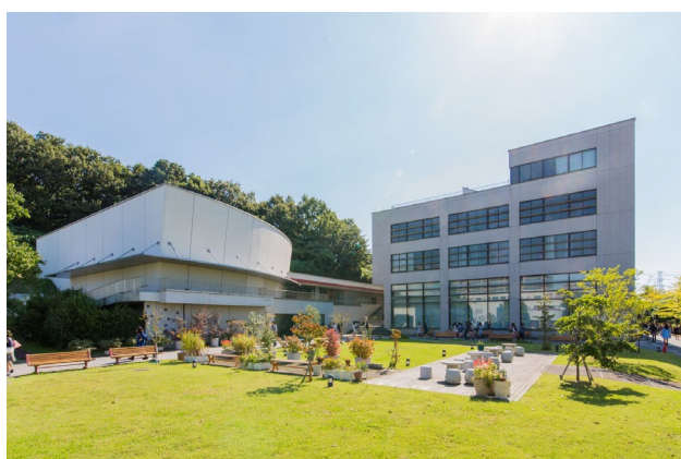
緑園キャンパス中央広場