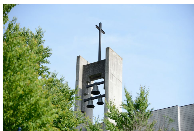
チャペル(カリヨンベル)