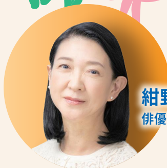
紺野 美沙子さん 俳優・朗読座主宰