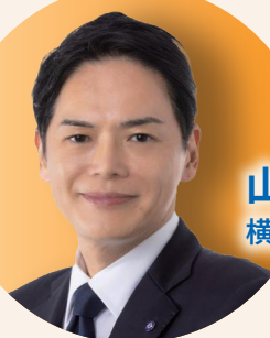
山中 竹春 横浜市長