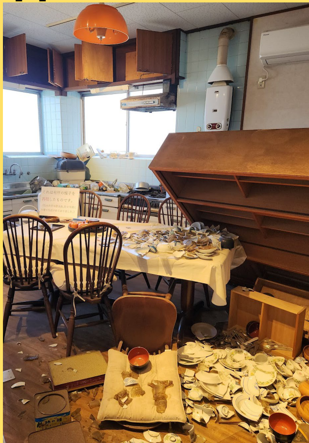
北茨震災記念公園 野島断層保存館にて撮影