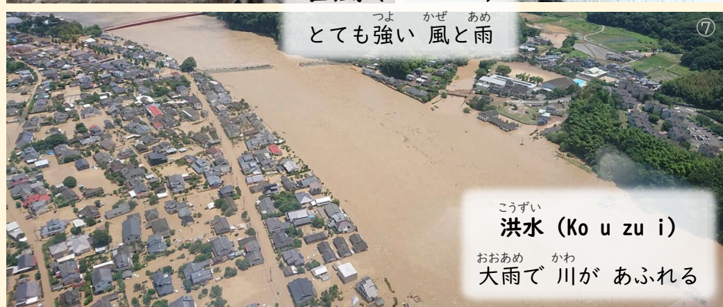
こうずい 洪水 (Ko u zu i) ④ おおあめ かわ 大雨で 川が あふれる