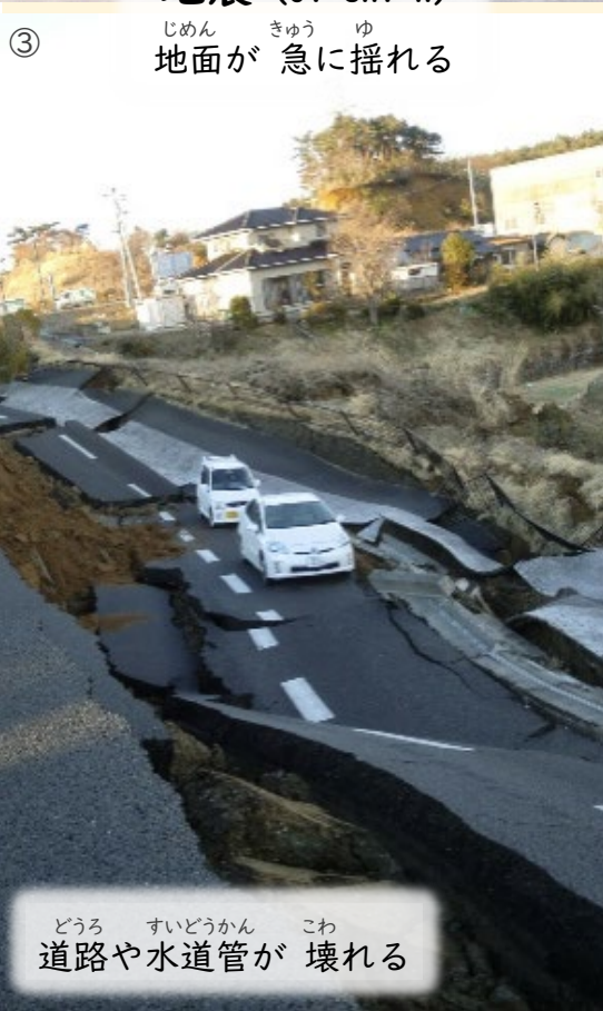
どうろ すいどうかん こわ 道路や水道管が 壊れる