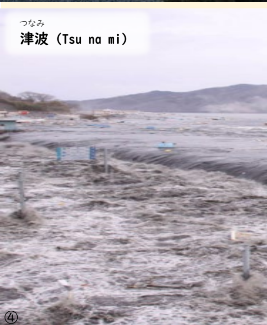
つなみ 津波 (Tsu na mi)