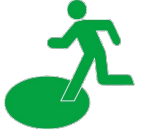
広域避難場所のマーク