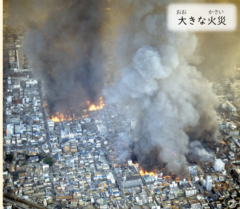
おお かい 大きな火災