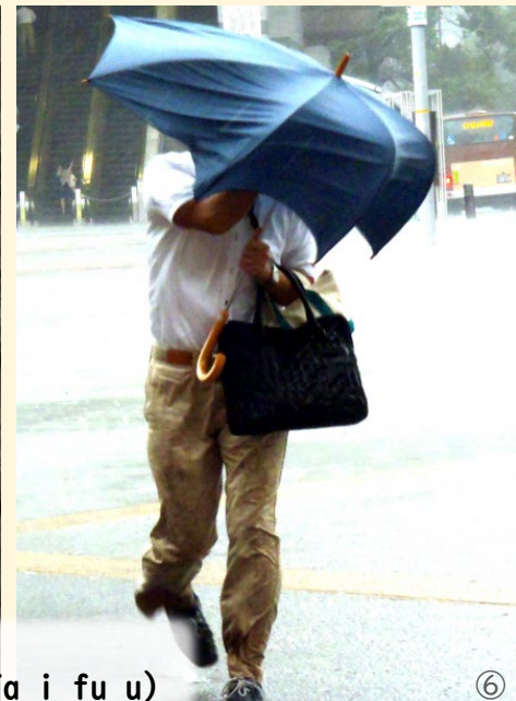
たいふう 台風 (Ta i fu u) ⑥ つよ かぜ あめ とても強い 風と雨 ⑦