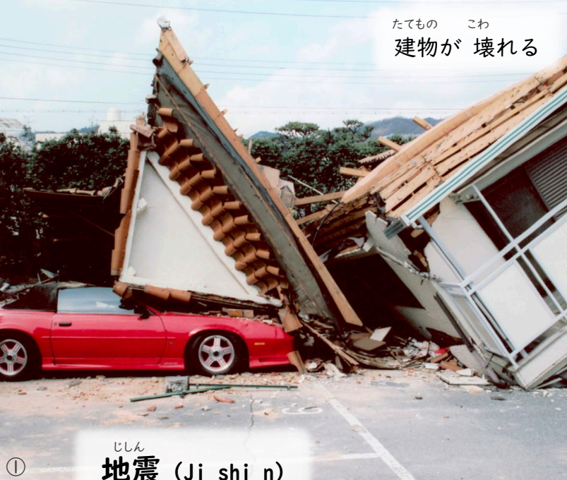
たてもの こわ 建物が 壊れる