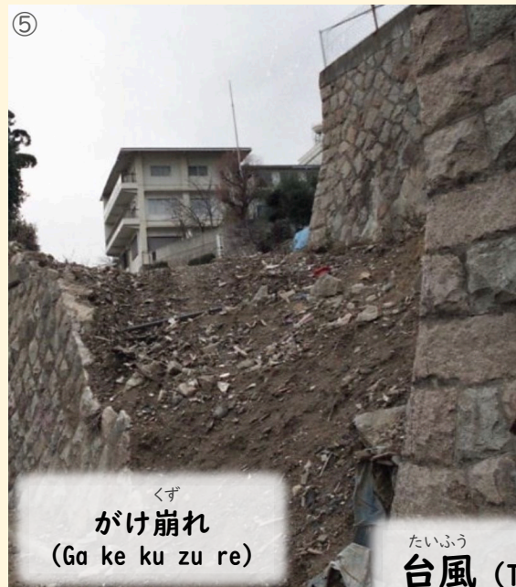
⑤ くず がけ崩れ (Ga ke ku zu re)