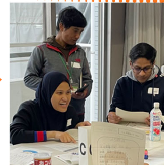
セリフを聞いた後、参加者が感じたことを話し合いました。