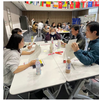
災害時の場面を再現した台本を使い、参加者が登場人物になりきって、セリフを読みます。