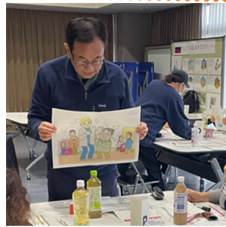
各グループで司会役を決め、話し合いを進めていきます。