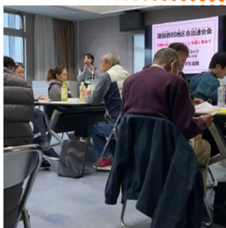
日本人と外国人を含む、5~6人のグループを6グループ作りしました。