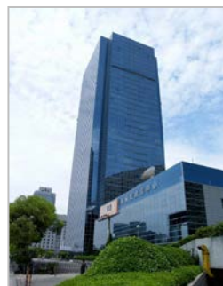
↑ 上海国際貿易中心のビル