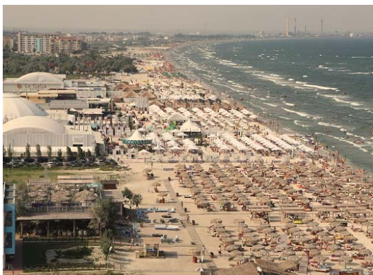
ママイアリゾート

人口は31万人、黒海の西岸に位置する港湾都市です。気候は、四季を通じて温暖で湿度が低く、観光資源もリゾートや歴史的な建造物、レジャー施設を有しています。