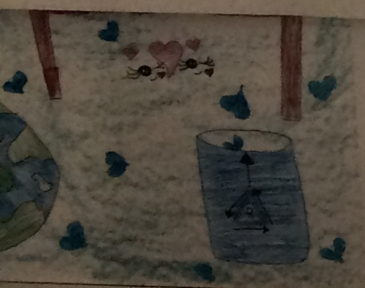
氏名: ... 学年: 2年 氏名: ... 動物を好きです。動物がたくさんある環境を楽しんでいます。動物を飼っています。