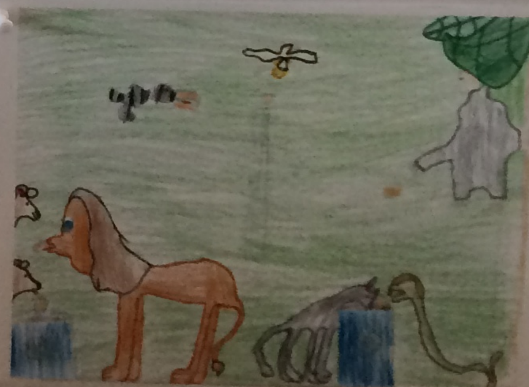
タイトル: 世界をもっと良くする方法 学校名: AdobeBluffs 学年: 2年 氏名: ジョリア