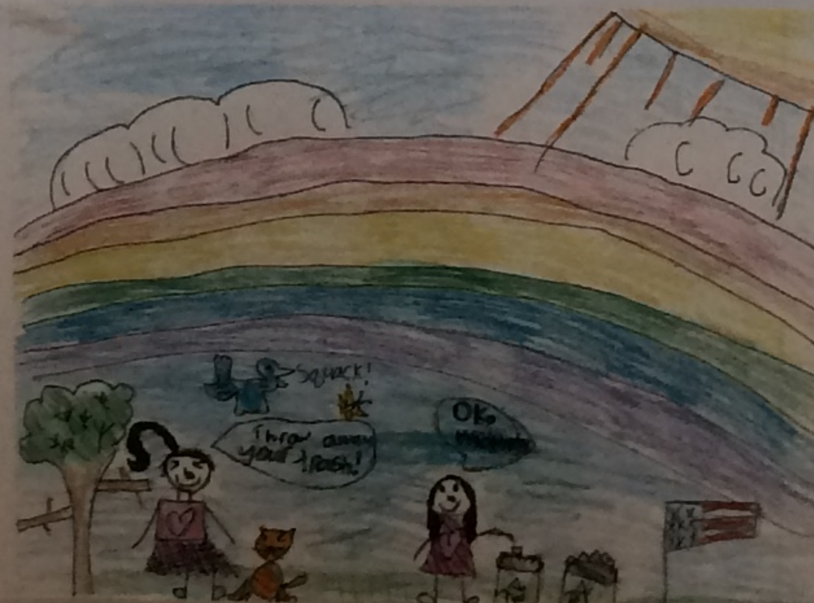
タイトル: 世界をもっと良くする方法 学校名: AdobeBluffs 学年: 2年 氏名: ジョリア もっとグリーンにする方法を教えてください。