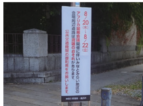
開港資料館前交差点