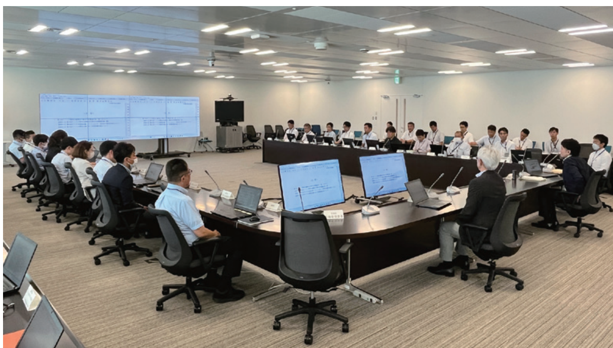
危機管理、施設・周辺環境部会合同開催の様子