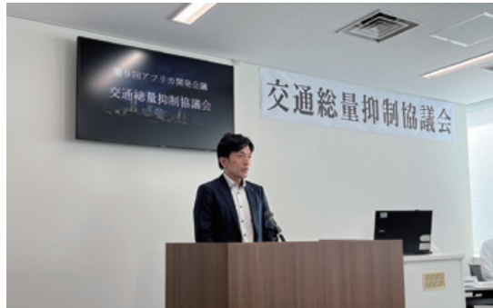
市の取組を説明する 横浜市国際局アフリカ開発会議担当部長