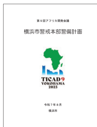
横浜市警戒本部警備計画