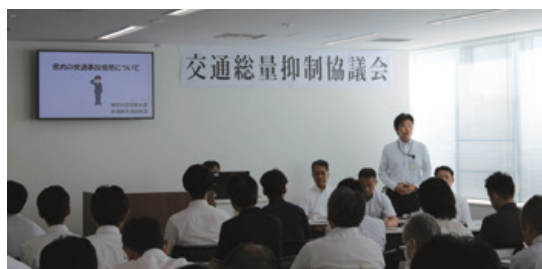
県警の取組を説明する 神奈川県警察本部交通部交通総務課長