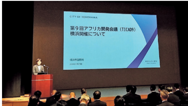
横浜市の取組紹介