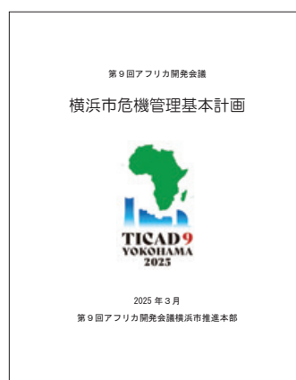
横浜市危機管理基本計画

部会へは、オブザーバーとして、神奈川県警察本部及び第三管区海上保安部にも参加いただき、活発な情報交換を行いました。