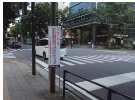
日本大通り入口交差点