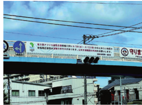
西横浜駅前交差点