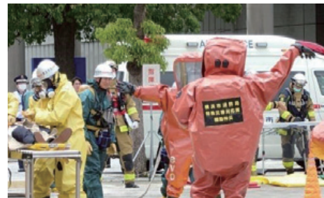
異臭事案対処訓練