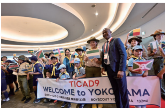
お出迎えの様子(左・右)