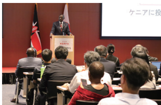
ルト大統領による基調講演