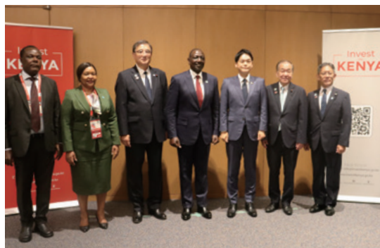
登壇者及び横浜市会関係者記念撮影