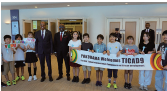
お出迎えの様子(左・右)