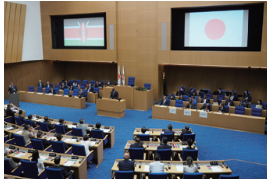
ルト大統領による横浜市会本会議場での演説