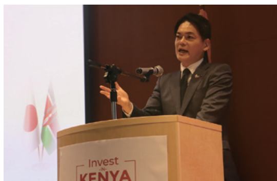
横浜市長による挨拶