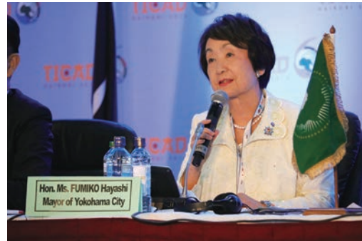
女性の社会経済開発改善サイドイベント

国土交通省主催のサイドイベントでパネルディスカッションに出席し、横浜市の都市課題解決の経験を紹介するとともに、アフリカの都市づくりに積極的に協力していくことを表明しました。