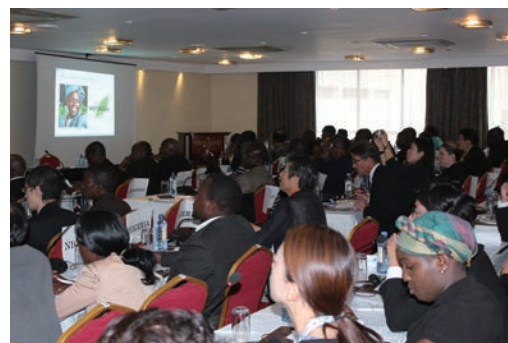
廃棄物管理セミナー