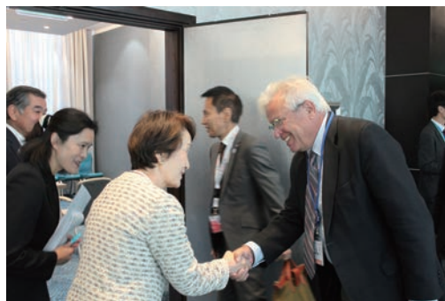
国連ハビタット事務局長面会