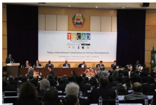
TICAD閣僚会合(モザンビーク)の様子