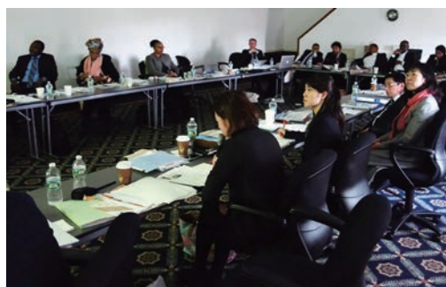
TICAD共催者会合(アメリカ)