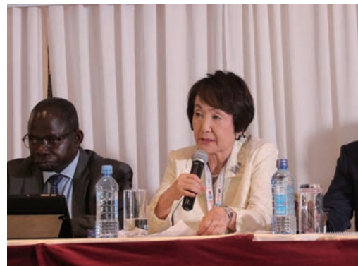
日・アフリカ官民インフラ会議