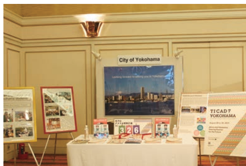
TICAD閣僚会合(東京) 横浜市PRブースの様子