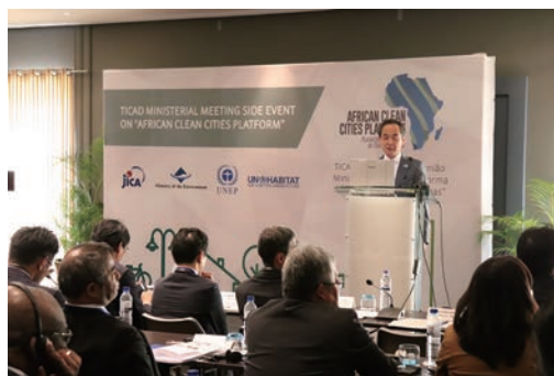
アフリカのきれいな街プラットフォーム