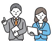
▶ 행정 운영의 기본 방침