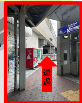
JR桜木町駅 (新南改札)