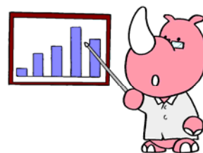
横浜市債の広報マスコット ハマサイ