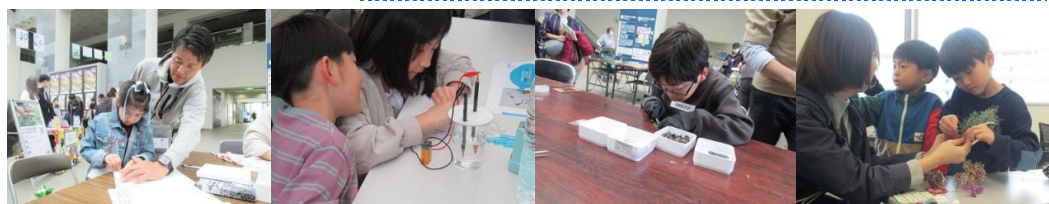
(昨年度開催した「eco チャレ 2024」の様子)

※当日に取材を希望される場合は、11月27日(木) 17時までに下記問合せ先(区政推進課)までご連絡ください。また、当日は都筑区役所正面玄関付近までお越しください。