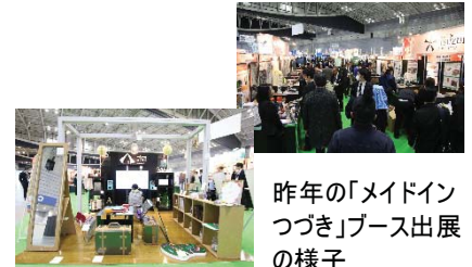
昨年の「メイドインつづき」ブース出展の様子

主催：（公財）神奈川産業振興センター・（一社）横浜市工業会連合会・ 神奈川県・横浜市