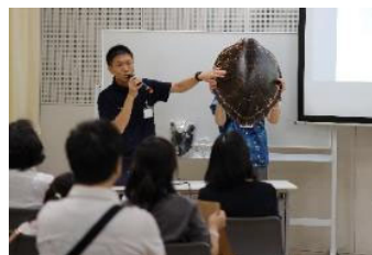
▲海の先生特別授業