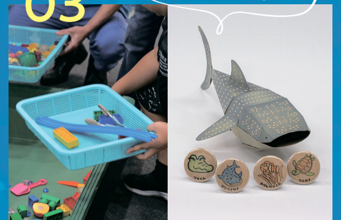
8/8 プラごみ分別 / 重さ当てゲーム