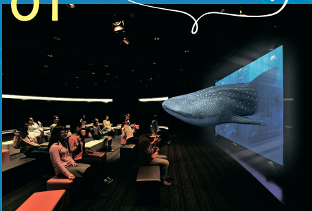
3D Okinawa Churaumi Aquarium & 3D 沖縄海中散歩