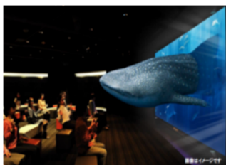
▲3D Okinawa Churaumi Aquarium & 3D 沖縄海中散歩