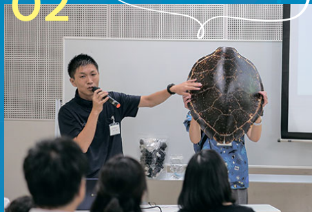
海の先生特別授業