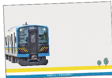
鶴見線の各駅の AR フォトフレームは、 新型車両をはじめ歴代の車両がモチーフ