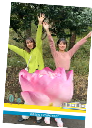
AR フォトフレーム撮影イメージ

AR フォトフレームで撮った写真や開催期間中におさめた鶴見の春の写真を送ることで応募できる賞品もあります。