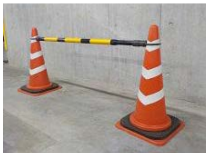
カラーコーンなど