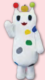
戸塚区のマスコット ワナシー