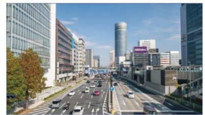
新横浜駅前の街並み