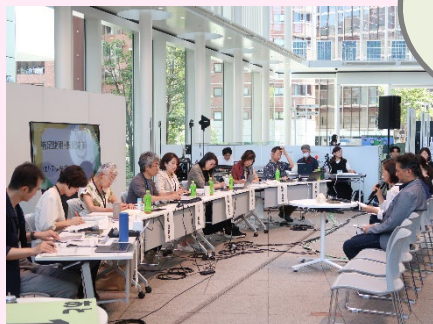
審査員との質疑応答