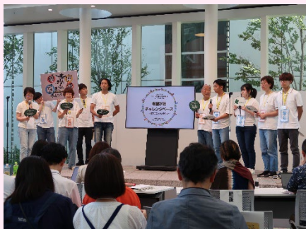
熱意溢れる提案発表