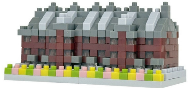
*咲き誇る花々と赤レンガ倉庫