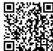
<ふるさと納税返礼品サイト> (nanoblock®)