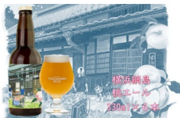
<横浜綱島桃エール> (返礼品)