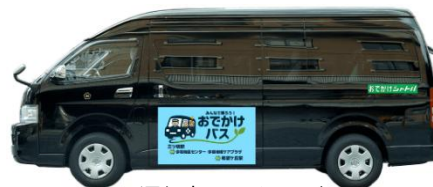
運行車両のイメージ