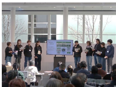
緊張感溢れるプレゼンテーション