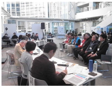
審査員との質疑応答